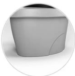
Устойчивый и надежный