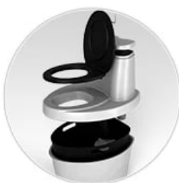
Легко собирается и сразу готов к эксплуатации