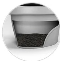
Низкая стоимость расходных материалов