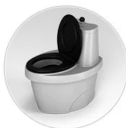
Не требует подключения к коммуникациям, воде, электричеству