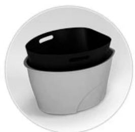
Предусмотрено ведро для легкого удаления отходов