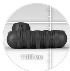
Плоская форма для экономного монтажа

Данная емкость имеет повышенную прочность. Ребра жесткости по периметру стенок исключают деформацию при эксплуатации. Под внешней крышкой предусмотрена площадка для установки дополнительных комплектующих и оборудования, например, насоса, уровнемера, топливозаборника.