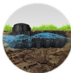
Устойчивость в грунтовых водах

Подземная накопительная емкость серии R предназначена для сбора, хранения и дальнейшего использования или утилизации технической, питьевой воды, хозяйственно-бытовых, дождевых и талых стоков.