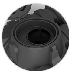
Дополнительная площадка для установки насоса или дополнительной арматуры