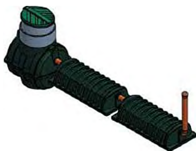
Септик «Rostok» Мини+ 2 дТ