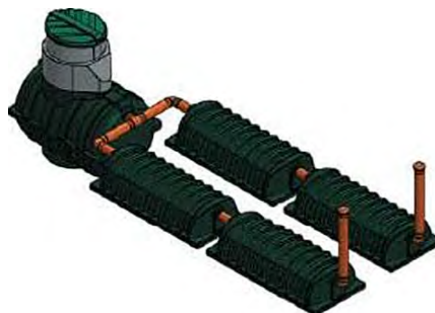
Септик «Rostok» Дачный + 4 дТ