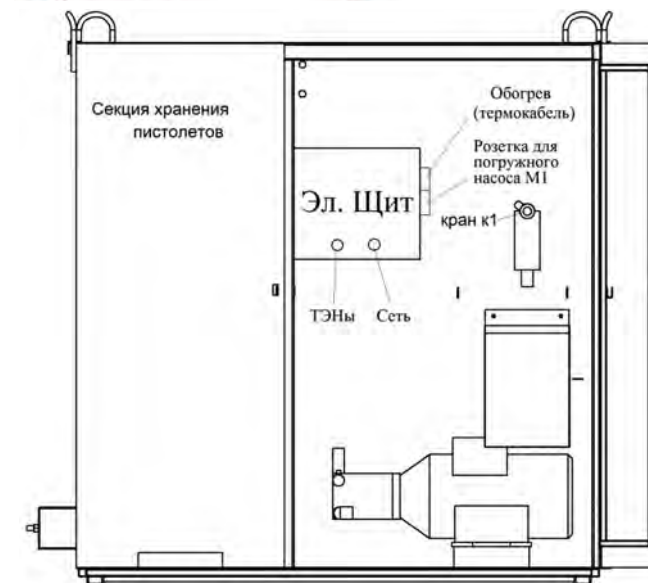
Схема расположения пункта мойки колёс